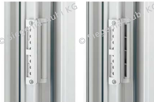
Eine starke Kombination: Mit dem neuen Drehverschluss kann der climAktiv PLUS geöffnet und geschlossen werden.